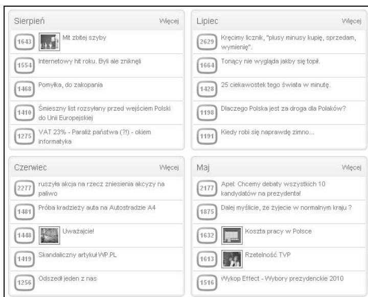
Rysunek 4.3. Najlepsze wykopy z czterech miesięcy (maj, czerwiec, lipiec, sierpień) 2010 roku